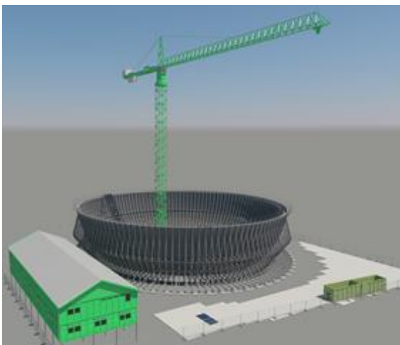
3D animatie van de bekistingen

Zoals u mogelijk al gezien heeft zijn we met een aantal werkzaamheden al een eindje boven de grond uitgekomen. De ronde fundering waarop de wanden worden geplaatst is nu bijna klaar. Het eerste wapeningsstaal van de wanden is geplaatst, net als de eerste bekistingselementen die perfect passen. Deze bekistingen zijn 6 meter hoog en vormen de wanden van de begane grond tot aan de eerste verdieping. Daarbovenop komt dan nog een ring van 6,5 meter hoog voor de wanden van de eerste verdieping.