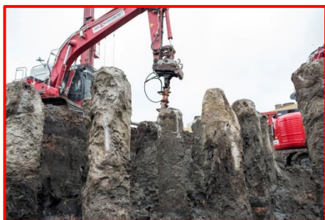
Ontgraven tussen de palen

Met de festivalorganisatoren van de diverse zomerfestivals in het Museumpark zijn afspraken gemaakt zodat deze festivals gewoon plaats kunnen vinden en het publiek veilig zijn weg kan vinden.