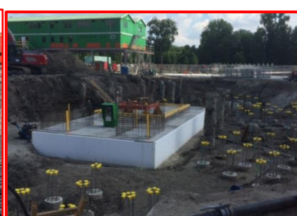
Gestorte kraanpoer (fundering)

Alle 279 funderingspalen zijn inmiddels aangebracht. We zijn nu bezig met het vrijmaken van de palen, graven van de sleuven voor de funderingsbalken en het op hoogte afhakken van de palen. De contour van het depot wordt al zichtbaar. Op de foto van de gestorte kraanpoer ziet u veel gele doppen op de wapeningsstaven zitten. Deze zijn er om verwondingen te voorkomen.