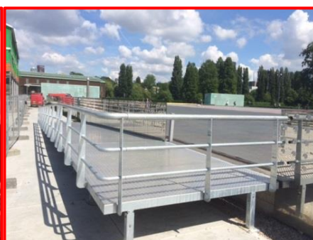
nieuwe hellingbaan langs de spiegelwand

De bouwkeet is op een staalconstructie geplaatst om tijdens diverse festiviteiten in de zomer voldoende ruimte te creëren en deze daarmee niet te veel te storen. Ook nog een foto van de nieuwe hellingbaan langs de spiegelwand. Deze wordt gebruikt voor mindervaliden en als extra vluchtroute tijdens de grote evenementen.